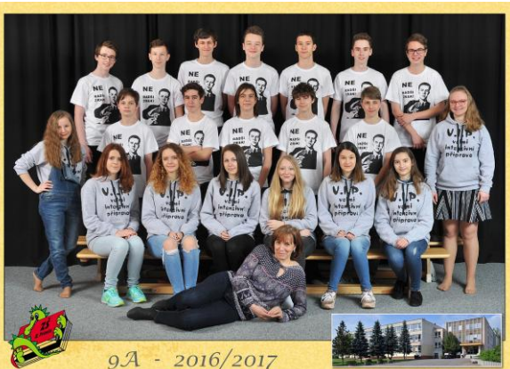
9A - 2016/2017