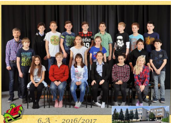
6.A - 2016/2017