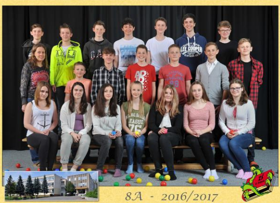
8A - 2016/2017