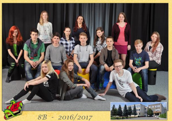
8B - 2016/2017