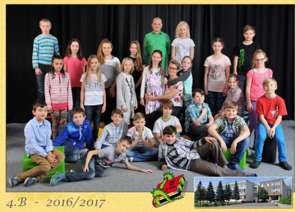
4.B - 2016/2017