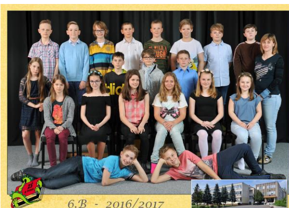
6.B - 2016/2017