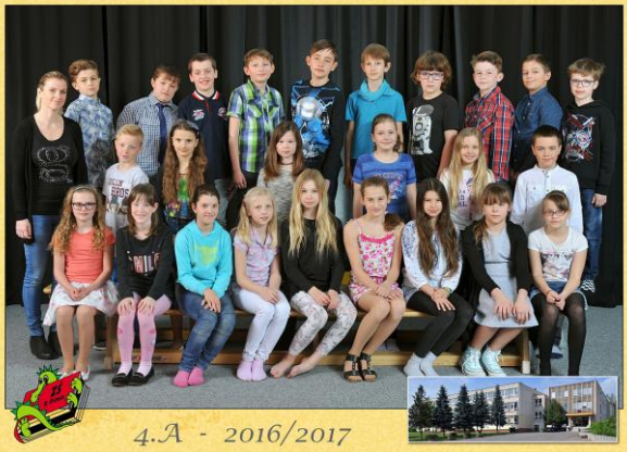
4.A - 2016/2017