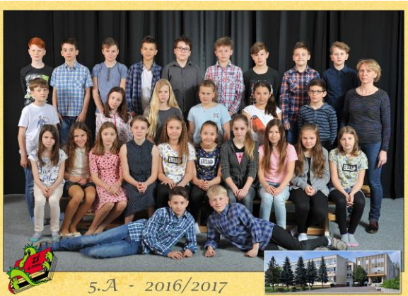
5.A - 2016/2017