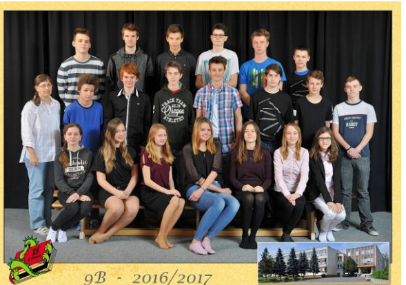
9B - 2016/2017