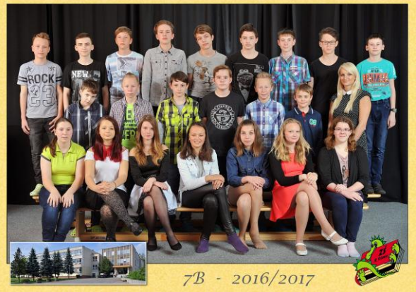
7B - 2016/2017