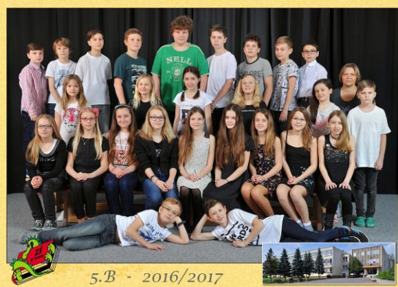
5.B - 2016/2017