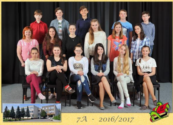
7A - 2016/2017